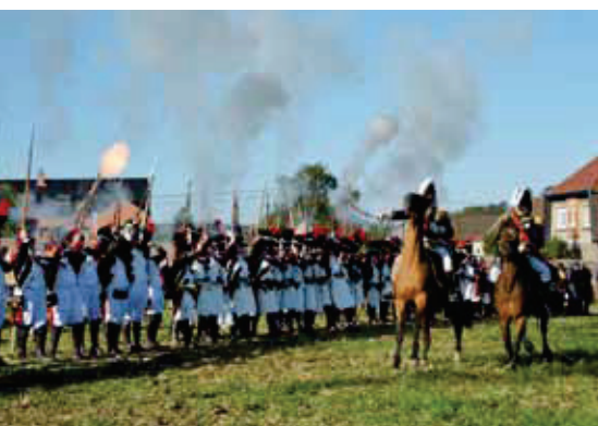
La marche septennale de la Saint-Feuillen

Chaque année, les marches folkloriques sillonnent les villes et villages de l'Entre-Sambre-et-Meuse pour perpétuer une tradition profondément ancrée dans le patrimoine culturel et folklorique des provinces de Namur et du Hainaut, celui de la « marche ». On en dénombre actuellement plus de quatre-vingts.